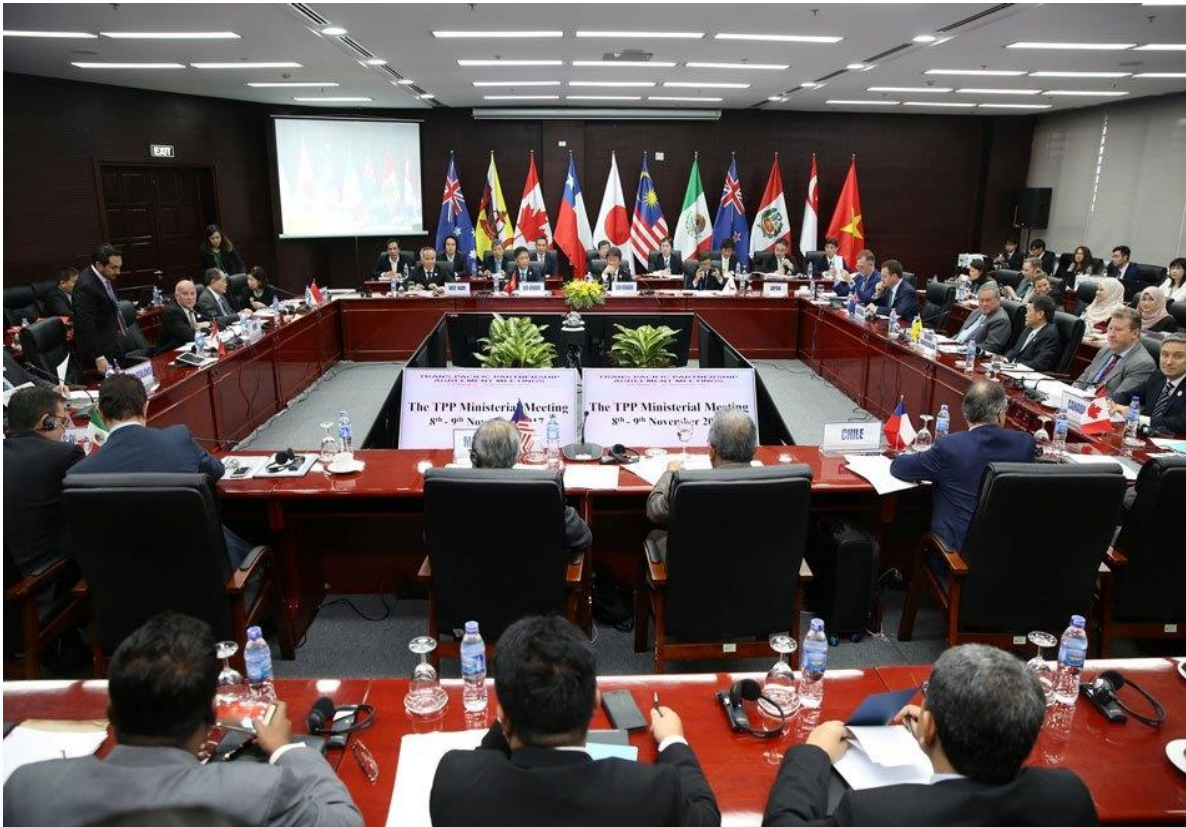
Phiên họp Ủy ban TBT

Về minh bạch hoá, các nước thành viên đều đánh giá cao tầm quan trọng và vai trò của Cơ quan thông báo và hỏi đáp về TBT quốc gia, đồng thời đề xuất tổ chức các phiên họp không chính thức giữa các cơ quan này nhằm thúc đẩy việc điều phối về minh bạch hoá trong phạm vi cam kết của Chương TBT CPTPP.