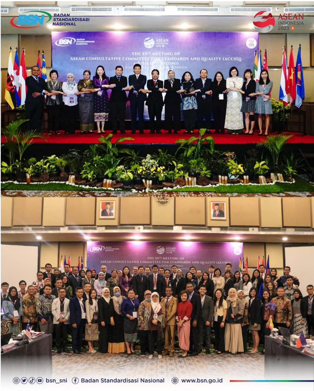
Ảnh. ACCSQ – cơ quan chủ trì sửa đổi Hiệp định AFA MRA.

Quy chuẩn kỹ thuật 2006, Luật Chất lượng Sản phẩm hàng hoá 2007 và các văn bản có liên quan.