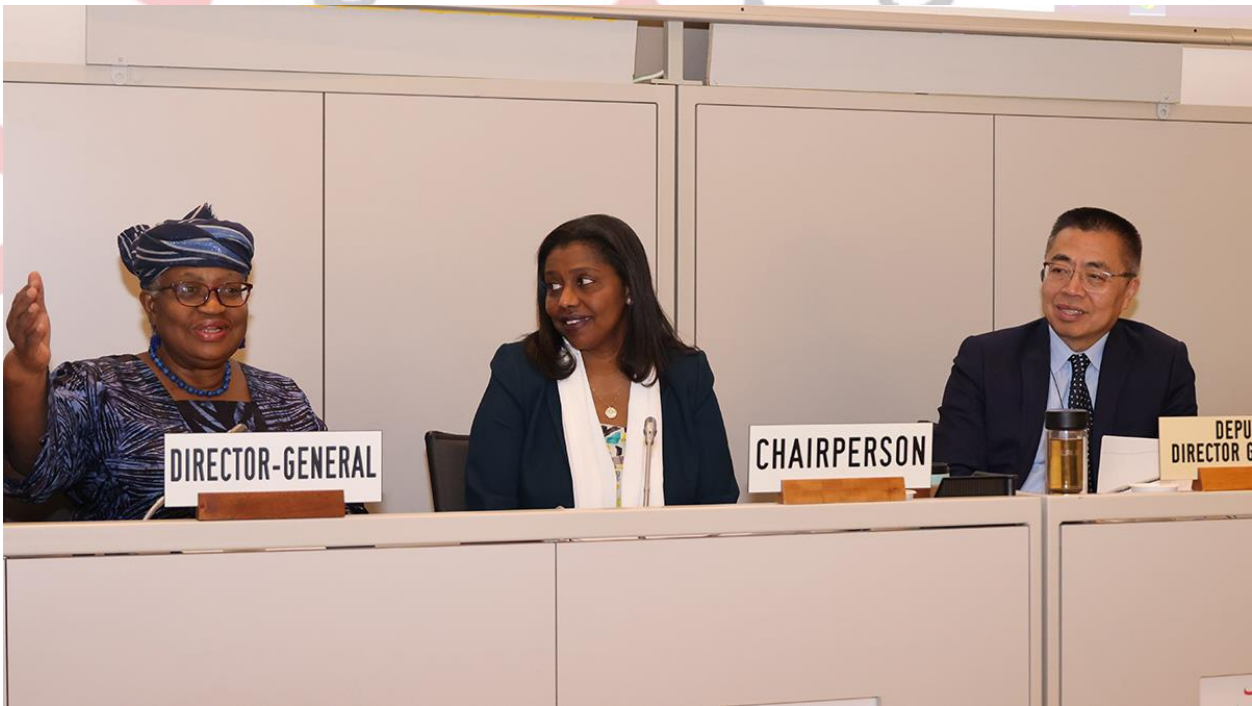
Ảnh: TGD WTO, bà Ngozi Okonjo-Iweala, tại phiên họp đặc biệt trước thềm MC13

Phát biểu tại cuộc họp Phiên họp đặc biệt của Ủy ban Thương mại và Phát triển vào ngày 8 tháng 2, Tổng Giám đốc Ngozi Okonjo-Iweala nhấn mạnh sự cần thiết phải đạt được các kết quả liên quan đến phát triển tại Hội nghị Bộ trưởng lần thứ 13 (MC13), dự kiến diễn ra tại Abu Dhabi từ ngày 26 đến ngày 29 tháng 2. Các thảo luận tập trung vào việc vận dụng tính linh hoạt dành cho các nền kinh tế đang phát triển có trong các hiệp định của WTO để các nền kinh tế này có thể đóng vai trò tích cực hơn trong thương mại quốc tế.