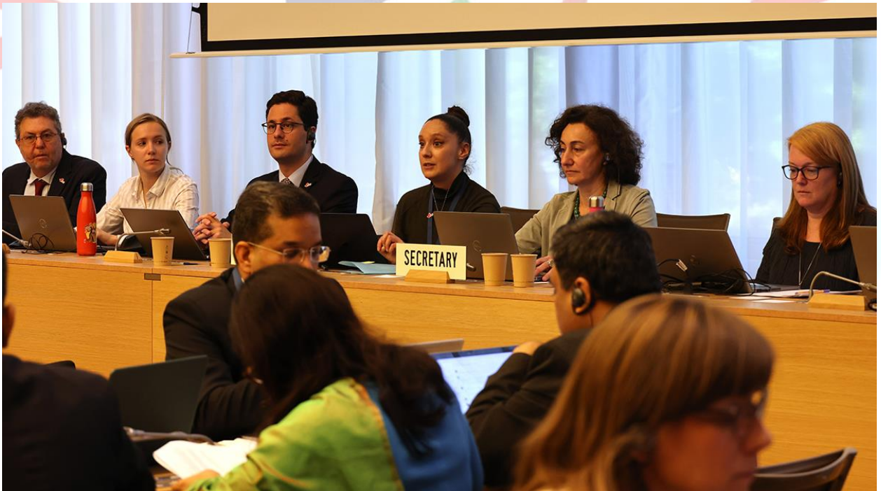
Ảnh: Phiên họp tháng 6/2024 của Ủy ban TBT (nguồn: WTO)

Tại cuộc họp không chính thức của Ủy Ban TBT vào sáng ngày 04/6/2024, các nước Thành viên gồm Hoa Kỳ, Trung Quốc, Paraguay, Brazil, Liên minh Châu Âu (EU), New Zealand, Vương quốc Anh (UK) và Australia đã trình bày 15 đề xuất của mình trong khuôn khổ Rà soát Ba năm lần thứ 10 về các chủ đề khác nhau và lắng nghe các câu hỏi cũng như góp ý của các nước Thành viên khác.