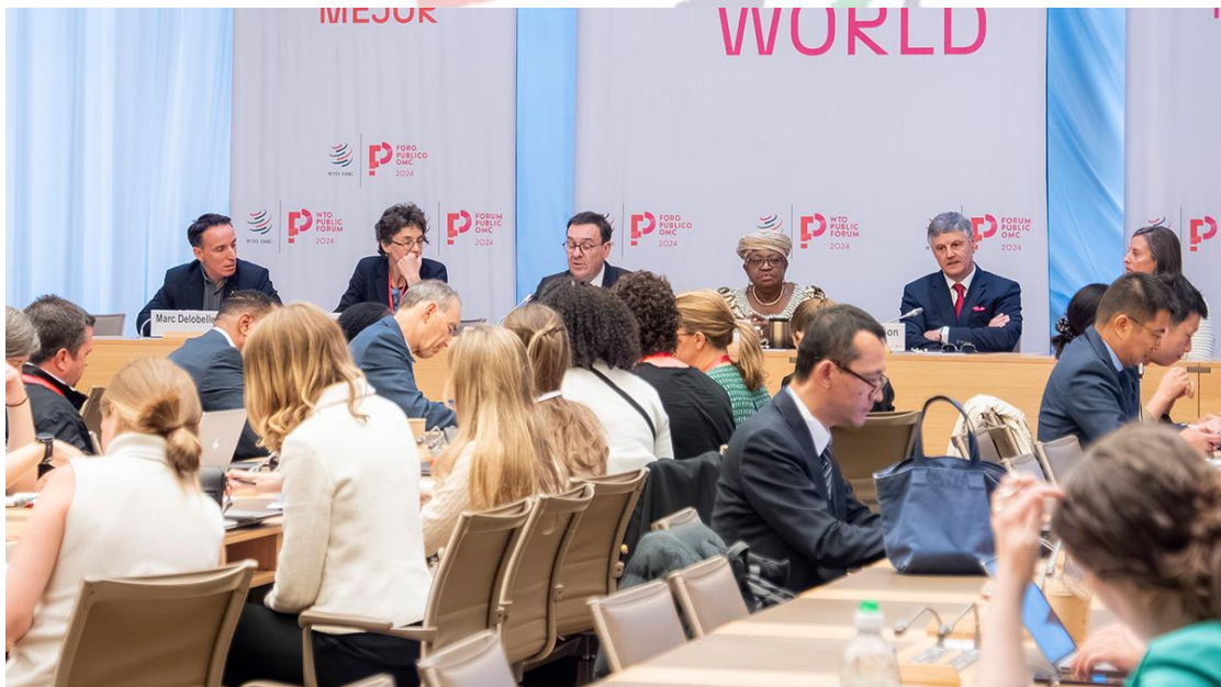
Ảnh: Toàn cảnh phiên họp của đại diện ngành thép toàn cầu trong khuôn khổ Diễn đàn Công cộng năm 2024 của WTO